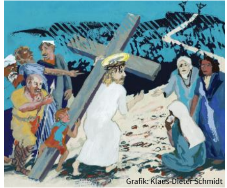
Grafik: Klaus-Dieter Schmidt

Die Singschule der Christuskirche bringt das Musical „Es ist vollbracht“ von Thomas Riegler auf die Bühne. Das Passionsspiel beginnt mit dem Einzug Jesu in Jerusalem, erzählt von Freundschaft, Verrat, der Auseinandersetzung mit Pharisäern u. Römern, der Gefangennahme u. Kreuzigung u. gibt am Ende einen Ausblick auf die Auferstehung. Das Stück will zu den elementaren Motiven des Christentums einen Zugang schaffen. Die Minis, Kids u. Teenies singen u. spielen zusammen mit einem Instrumentalensemble u. Tänzerinnen unter der Leitung von KMD Karin u. KMD Thomas Riegler. Lassen Sie sich hineinnehmen in die größte Geschichte aller Zeiten u. tauchen Sie ein in eine aufwändige Inszenierung mit berührender Musik.