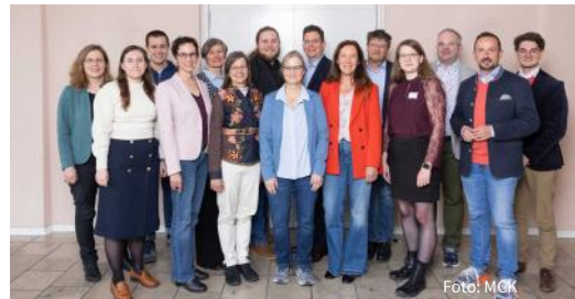
Die Mitglieder des Landessynodalausschusses

Wir gratulieren sehr herzlich und wünschen Gottes Segen für dieses Ehrenamt.